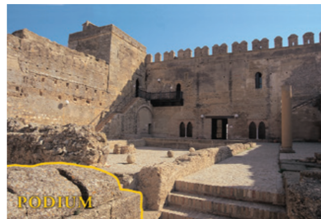
Salón de los Presos y Patio de los Aljibes. En primer plano el Podium del Templo Romano.