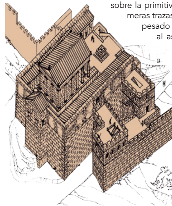
Hipótesis de restitución en época de Augusto (s. I. a. C.)

Los cartagineses construyeron un baluarte sobre la primitiva torre, confiriéndole las primeras trazas de su aspecto cuadrangular, pesado y potente para hacer frente al asalto de los ejércitos enemigos.