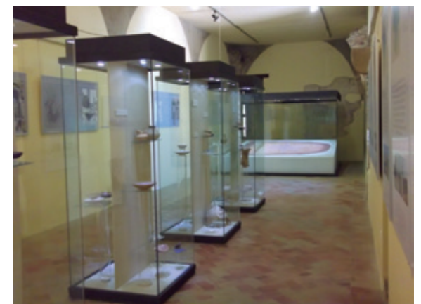
Interior del Salón de Presos alto