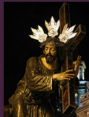
Nuestro Padre Jesús Nazareno

Destaca el simpecado de hacia 1750 y bordado protorococó, presidido por una pintura de la dolorosa coetánea. Junto a él, son reseñables la Cruz de las Esclavas, por su valor estético y simbólico, el conjunto inmaculista de espada, vela y bandera, el senatus, y las distintas pértigas barrocas y varas decimonónicas de los acompañantes.