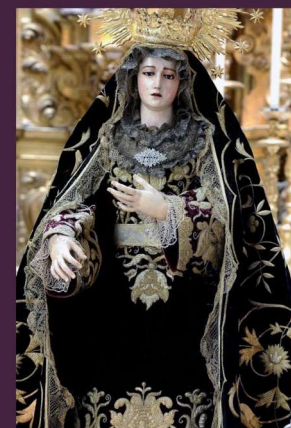
María Santísima de Los Dolores