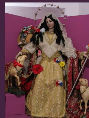
Divina Pastora de las Almas